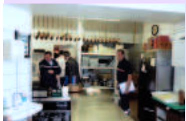
Saint Justin : visite des cuisines de l'hôtel-restaurant

A l'issue de la visite le préventionniste relit l'ensemble du rapport. Le préventionniste fait quelques annotations en plus des prescriptions (le cas échéant) et rend l'avis favorable ou défavorable. Le document est alors signé par l'ensemble des membres du groupe de visite.