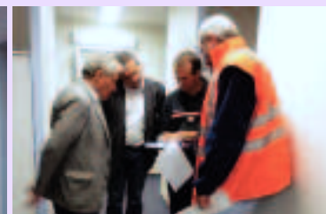
Gabarret : relecture du rapport par le groupe de visite

10h15 – Mont de Marsan - Visite d'une discothèque fermée depuis 3 mois – Etablissement de 3ème catégorie.